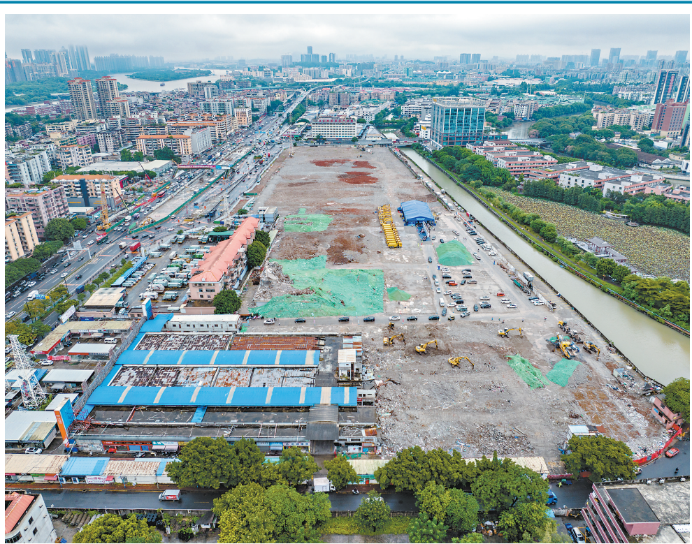
广州湾区新岸(罗冲围片区)首批安置工程动工仪式现场。

除了已经启动建设的项目外,三元里片区控规方案已获市政府批复,萧岗、棠涌、棠溪等村的首开区方案已基本稳定,正在加快落地。