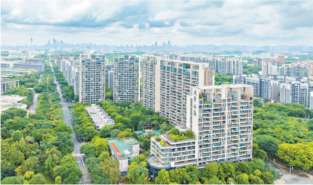
降息有助于降低居民购房成本,进而推动房价企稳。

记者了解到,首付比例方面,广州目前执行首套房首付比例15%,二套房25%的政策,但在租一买一、卖一买一的政策支持下,按规定取得房屋租赁登记备案证明或将名下房屋挂售并取得房源信息编码的,购买住房时即可相应核减名下住房套数。