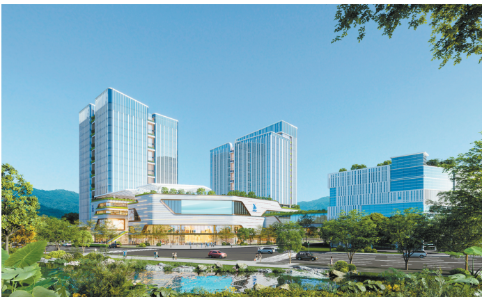
项目效果图

广州日报讯(全媒体记者 汤南 通讯员郑少敏)昨日,广州兴发广场美湾二期改造提升项目动工仪式举行。